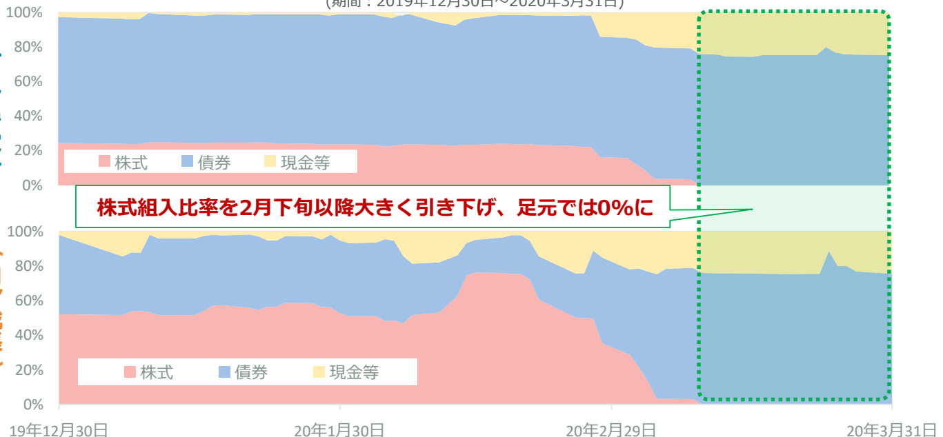
＜資産別組入比率の推移＞ （期間：2019年12月30日～2020年3月31日）

※コア安定・コア成長ならびに国内株式、先進国株式は2019年12月30日の価格を100として指数化しています。 ※国内株式と先進国株式はコア安定・コア成長が投資する指定投資信託証券の基準価額の推移です。